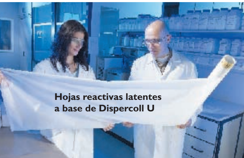
Hojas reactivas latentes a base de Dispercoll U

Las hojas adhesivas y hojas reactivas latentes, dotadas de capas de adhesivo reactivas latentes, podrían simplificar muchos procesos industriales. Para su obtención se aplican adhesivos de dispersión acuosos reactivos latentes sobre un portador o sobre hojas técnicas y después se secan. Los expertos en adhesivos de Bayer MaterialScience han demostrado ahora que, a pesar de la activabilidad de las capas y películas de adhesivo reactivo latente a aproximadamente 70 a 90°C, el secado se puede llevar a cabo bajo condiciones rentables. En lo anterior, la temperatura de la película de adhesivo puede subir brevemente a hasta 50°C sin que inicie la reacción de reticulación del polímero.